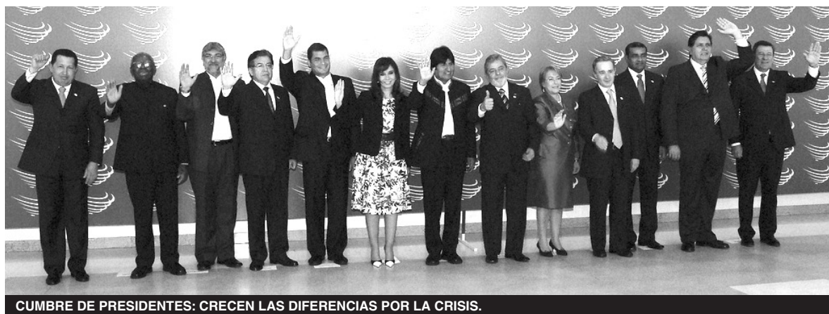
CUMBRE DE PRESIDENTES: CRECEN LAS DIFERENCIAS POR LA CRISIS.

¿Qué potencias y qué monopolios ganarán o perderán con la crisis? América Latina, tablero estratégico: yanquis, golpeados; Rusia retorna; China teje; europeos, hacia una nueva cumbre iberoamericana.